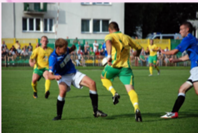
Ligowe rozgrywki KS Ostrowia

• Festiwal Zdrowia i Urody „Miasto dla Kobiet”; • Ogólnopolski Konkurs Tańca „Wirujący Krąg”; • maraton taneczny Zumbi; • występy kabaretów (w tym