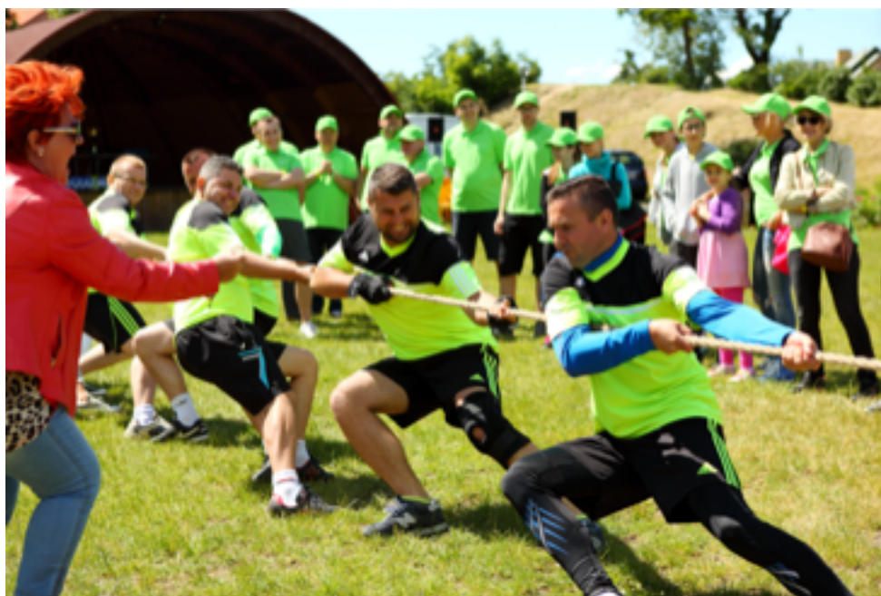
I Ostrowskie Igrzyska Firm - Dzień Sportu i Rekreacji

1974, 1976, 1978, 1984/5, 1987; II edycja 1994 – 2015, (udział szkół gminy Ostrów Mazowiecka do roku 1999) - Miejska Gimnazjada Sportowa (lata 2000 – 2015);