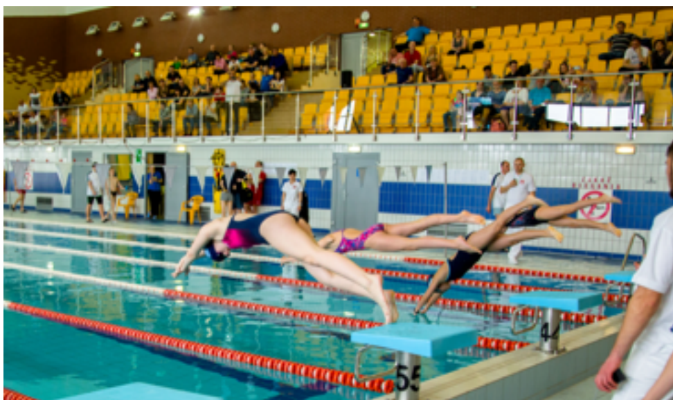
Mistrzostwa Miasta Szkół w Pływaniu