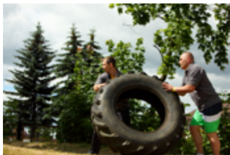
I Ostrowskie Igrzyska Firm

1974, 1976, 1978, 1984/5, 1987; II edycja 1994 – 2015, (udział szkół gminy Ostrów Mazowiecka do roku 1999) - Miejska Gimnazjada Sportowa (lata 2000 – 2015);