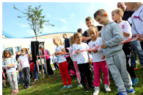
Mistrzostwa Miasta Szkół i Przedszkoli

- Powiatowa Olimpiada Młodzieży - szkoły ponadpodstawowe (2000 – 2004); - Miejska Spartakiada Zakładów Pracy (1993 - 1999); udział brały m.in. Zurał, Forte, Mleczarnia, Miwex, Kruger, Bumar - Waryński, Jednostka Wojskowa, Straż, ZGKiM, Policja; - organizacja wojewódzkich finałów tur-