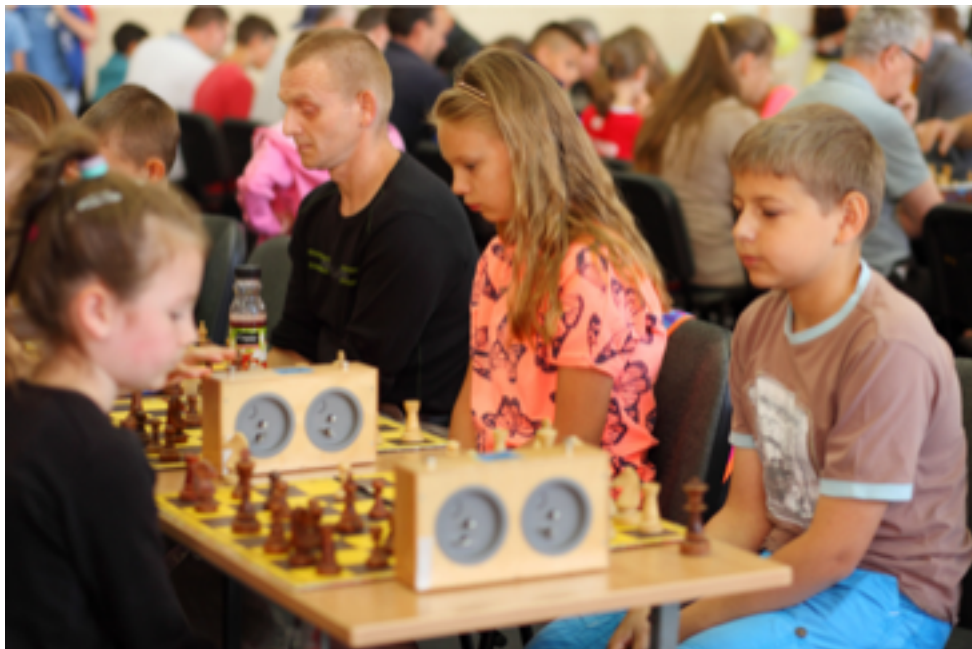
Otwarte Mistrzostwa Miasta w Szachach