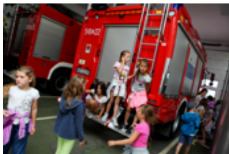
Półkolonie z MOSiR

nieju Trybuny Mazowieckiej, a później Naszej Trybuny w tenisie stołowym;