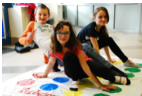
Ferie zimowe z MOSiR