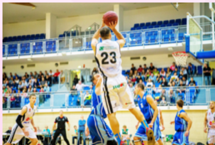
Ligowe rozgrywki OKK Sokół

rencjach); • Ostrowskie Igrzyska Przedzszkolaków; • półprofesjonalne imprezy biegowe: Bieg Konstytucji, Bieg Wolności i Solidarności (od bieżącego roku rozgrywany również jako półmaraton)