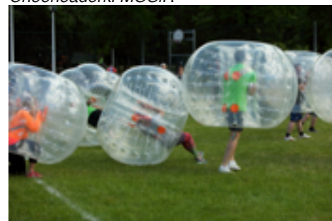
Dzień Sportu i Rekreacji

wody strefowe w koszykówce dziewcząt w ramach VII OSM-1980 rok; - finałowe zawody w koszykówce chłopców i piłce ręcznej dziewcząt w ramach Ogólnopolskiej Olimpiady Młodzieży - 1990 rok; - 1986 - etap Międzynarodowego Wyścigu Kolarskiego o Puchar Sztandaru Młodych w 100-lecie kolarstwa Polskiego z udziałem Ryszarda Szurkowskiego i mistrza Świata Lecha Piaseckiego; - cykliczne ogólnopolskie turnieje brydża sportowego „O złoty pierścień Ostrowi”; - organizacja meczu Orły Górskiego - Radni Miasta i Powiatu - 2008 rok; - Debiuty Polskiego Związku Kulturyścistyki, Fitness i Trójboju Siłowego (2003 - 2014); - tenisowy Turniej Miast (2004-2013). - Lato z Radiem - w tym m.in. koncert zespołu BAJM (2008 rok); - koncert zespołu BUDKA SUFLERA (2003 rok); - występ Państwowego Zespołu Ludowego Pieśni i Tańca MAZOWSZE - 2006 i 2009 rok; - cykliczne występy najpopularniejszych kabaretów (Kabaret Moralnego Niepokoju, OT TO, Paranienormalni, Neonówka, Smile, itp.); - Ogólnopolski Festiwal Amatorskich Zespołów Tanecznych - trzy edycje (lata 2000-2002), następnie kontynuowany przez MDK jako „Wirujący krąg”; - Festiwal Zdrowia i Urody Miasto dla Kobiet - cykliczna impreza adresowana do pań z okazji święta Kobiet - sześć edycji do chwili obecnej. ■