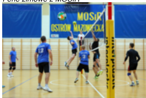
Liga Siatkarzy Amatorów